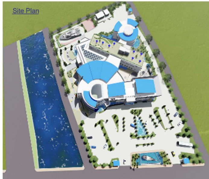
Gambar 4. Siteplan

lainnya. Jika dilihat dari atas bentuk massa bangunan menyerupai bentuk jangkar pada kapal, dengan ini siteplan menggunakan konsep metafora.