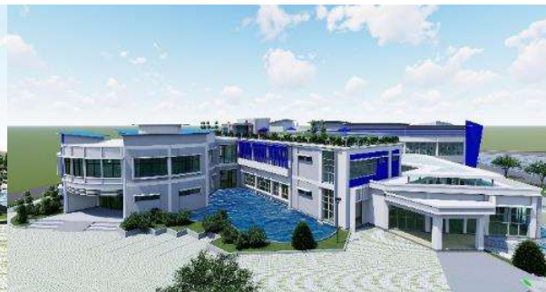
Gambar 7. Pespektif Eksterior