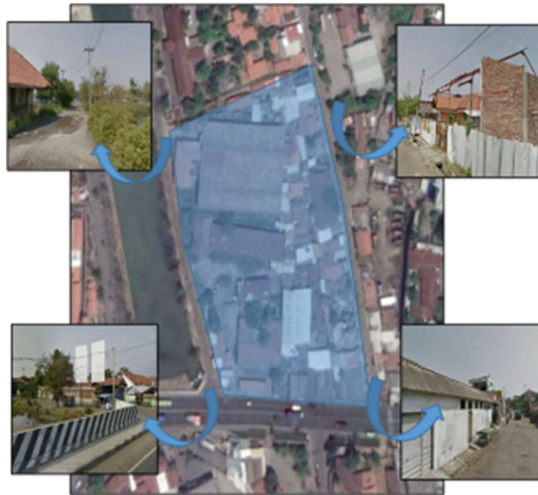
Gambar 1. Kondisi Site

Lokasi tapak terpilih berada di Bagian Wilayah Kota (BWK) A wilayah Kecamatan Tegal Timur, yakni di Jalan Yos Sudarso, dengan luasan tapak \pm 1.5 Ha dan luas bangunan \pm 0.6 Ha. Batas-batas lokasi tapak di sebelah Utara yaitu Kantor Kementerian Keuangan RI wilayah kerja Kota Tegal, Sebelah Selatan yaitu Jalan Yos Sudarso, Sebelah Barat yaitu Jalan Sumbawa sedangkan Sebelah Timur Jalan Bali dan Permukiman Warga.