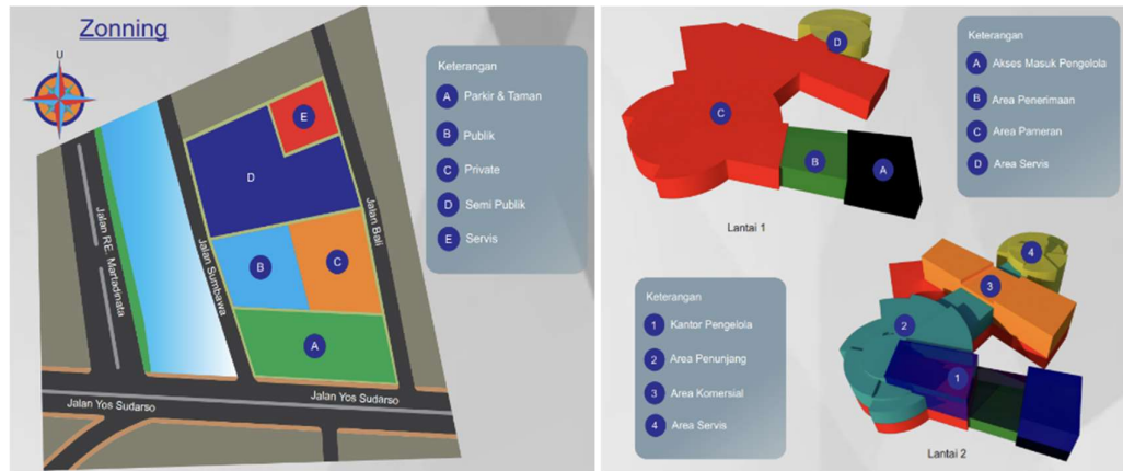
Gambar 2. Zoning