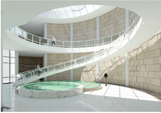
Gambar 8. Interior Hall/ Lobby Tengah