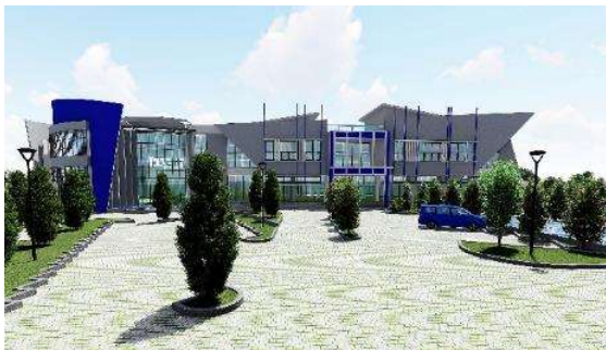
Gambar 6. Pespektif Eksterior Sumber. Analisa Penulis

Penggunaan Konsep Arsitektur Modern yang diterapkan pada fasad bangunan merupakan pilihan yang tepat karena jika dilihat pada Gambar 6. dan Gambar 7. memiliki bukaan kaca yang banyak untuk memanfaatkan pencahayaan dan penghawaan alami, serta pemilihan warna pada fasade bangunan yang berwarna putih dan biru seperti melambangkan warna air.