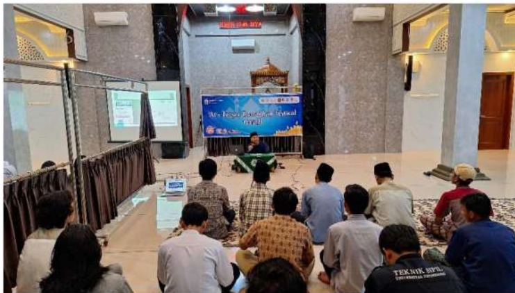
Gambar 2. Penyampaian materi oleh penulis

Setelah sesi materi dari penulis selesai (gambar 2) maka kegiatan pelatihan dilanjutkan dengan tanya jawab (gambar 3 dan 4).