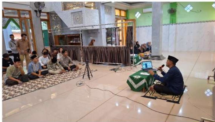
Gambar 3 dan 4. Kegiatan Diskusi dan Tanya jawab