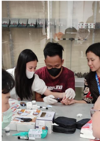
Gambar 2. Pelaksanaan Pemeriksaan Kesehatan dalam Pemeriksaan Darah