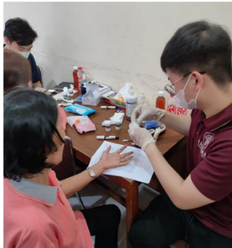
Gambar 1. Rangkaian Kegiatan Penapisan di Fransiskus Asisi

Kegiatan pengabdian masyarakat ini mengikutsertakan 35 wanita usia lanjut yang dilakukan di Gereja St. Fransiskus Asisi, Jakarta Selatan. Adapun rangkaian kegiatan wawancara dan pemeriksaan penunjang berupa kadar hemoglobin dan hematokrit (Gambar 1), karakteristik dasar responden tergambar pada Tabel 1 dan gambaran rerata kadar hemoglobin dan hematokrit di deskripsikan pada gambar 2 dan gambar 3.