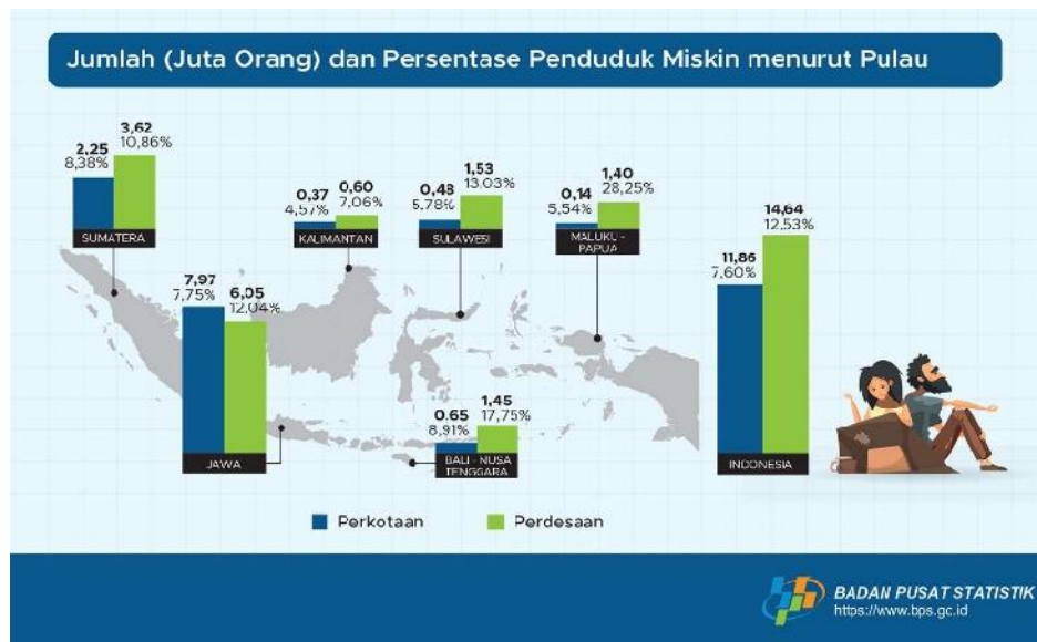
Gambar 2. Persentase Penduduk Miskin Menurut Pulau

Berdasarkan data diatas, Jumlah Penduduk miskin di Indonesia yaitu 26,50 Juta Jiwa dengan presentase 9,71%. Sedangkan penduduk miskin menurut pulau pada perkotaan sejumlah 11,86 juta jiwa dengan presentase 7,60%, pada perdesaan sejumlah 14,64 juta jiwa dengan presentase 12,53%. Permasalahannya adalah, dengan adanya reformasi