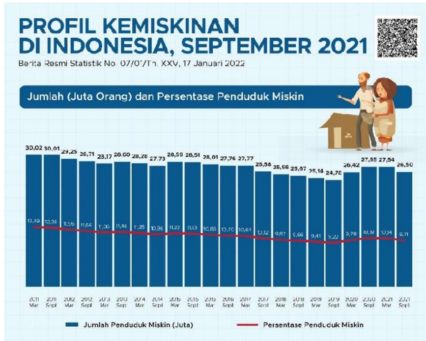
Gambar 1. Profil Kemiskinan di Indonesia September 2021