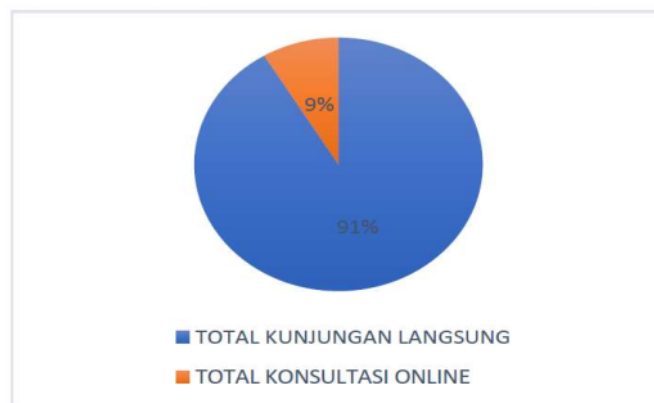
Gambar 1. 5 Diagram Pengguna Layanan 2022