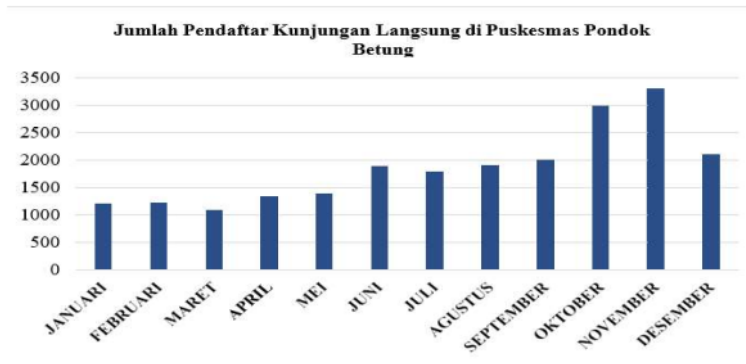
Gambar 1. 1 Data Pendaftar Layanan Konsultasi Langsung 2022

staf Puskesmas Pondok Betung menunjukkan bahwa ada beberapa masalah dalam penerapannya. Diperoleh data sebagai berikut :