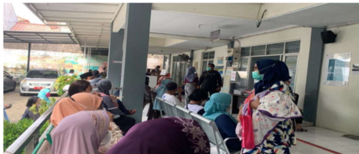
Gambar 1. 3 Antrian Masyarakat

Hasil penelitian menunjukkan bahwa Puskesmas Pondok Betung telah berhasil mencapai kesesuaian antara peserta program dengan sasaran yang ditetapkan. Namun, terdapat temuan di lapangan yang menyatakan bahwa ketepatan sasaran dalam program konsultasi online masih belum optimal, sehingga sebagian masyarakat masih memilih untuk melakukan konsultasi secara manual dengan datang langsung ke puskesmas. Selain itu, banyak warga di sekitar Pondok Betung yang tidak mengetahui tentang layanan konsultasi online yang tersedia di Puskesmas tersebut.