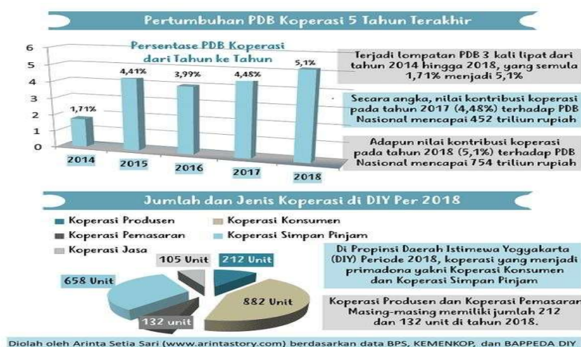
Gambar 1. Data Pertumbuhan Koperasi Di Indonesia