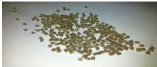
Gambar 1. Produk Biji Plastik HD

berserabut, dan ukuran lebih kecil (Wawancara berdasarkan daryono sebagai pelaku usaha). Berdasarkan kualitas produk adalah faktor-faktor yang terkandung pada suatu barang atau hasil yang cocok dengan suatu tujuan barang yang diproduksi menurut Satdiah dkk (2023). Berikut ini adalah gambar produk cacat atau kualitas kurang baik, seperti berikut: