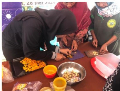
Gambar 4. Pelaksanaan Demonstrasi

Ibuk Plandi merupakan produk hasil inovasi pemanfaatan tanaman TOGA hasil berkebun Ibu PKK Desa Plandi oleh Tim Pengabdian Mahasiswa. Produk Ibuk Plandi antara lain kunyit bubuk, jahe bubuk, dan kencur bubuk. Dalam praktek pembuatan produk ini menggunakan 2 teknik yaitu dijemur dan dipanggang. Hal ini bertujuan agar ibu-ibu bisa lebih inovatif meskipun hanya menggunakan bahan dan alat sederhana yang ada dirumah.