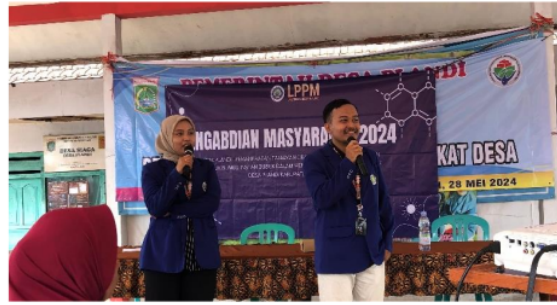
Gambar 3. Pendampingan Kewirausahaan