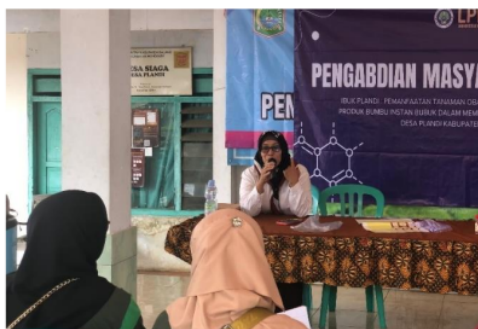
Gambar 6. Evaluasi Kegiatan

Evaluasi dilaksanakan dalam bentuk sharing antara tim pengabdian mahasiswa dan mitra sasaran. Evaluasi kegiatan dilaksanakan pada tanggal 31 Mei 2024. Hal ini bertujuan untuk mengetahui respon, tanggapan, saran maupun kritik mitra terhadap pelaksanaan pengabdian yang sudah berlangsung, serta memaparkan hasil pre-test dan post-test. Selain itu, dilaksanakan pemberian cinderamata oleh tim pengabdian mahasiswa kepada PKK Desa Plandi.