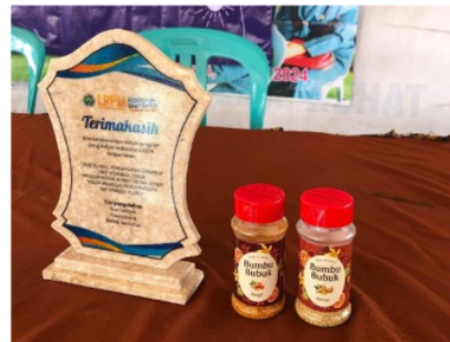
Gambar 5. Produk "Ibuk Plandi"