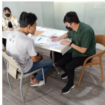
Gambar 1. Pelaksanaan Kegiatan di PT Narindo

Kegiatan Pengabdian Masyarakat ini dilakukan di PT Narindo, Jakarta Utara. Kegiatan ini diikuti oleh 126 peserta. Seluruh peserta yang mengikuti kegiatan dilakukan pemeriksaan darah berupa kadar hemoglobin dan hematokrit (Gambar 1). Hasil kegiatan berupa kadar hemoglobin dan hematokrit serta data dasar peserta disajikan dalam Tabel 1. Kesimpulan hasil pemeriksaan kadar hemoglobin ditunjukkan pada Gambar 2.