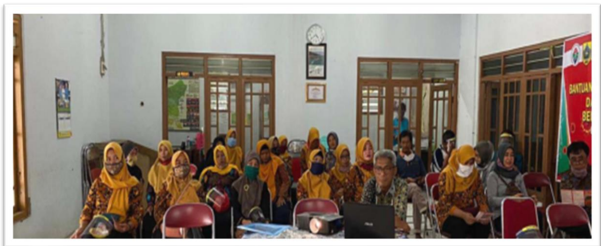
Gambar 2: Peserta Pelatihan Pengelolaan Sampah