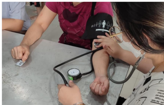
Gambar 2. Kegiatan Pengukuran Tekanan Darah

Dalam perjalanan penyakit hipertensi beberapa komplikasi yang dapat ditimbulkan seperti : stroke, gagal ginjal, gagal jantung. Komplikasi kardiovaskular (CV) merupakan penyebab paling umum dari morbiditas dan mortalitas pada pasien hipertensi. Mortalitas akibat penyakit jantung iskemik dan stroke sangat berkorelasi dengan tekanan darah. Oleh karena itu, pada individu dengan tekanan darah 115/75 mmHg, risiko penyakit kardiovaskular meningkat dua kali lipat untuk setiap peningkatan sebesar 20/10 mmHg. Pada individu dengan tekanan darah sistolik (SBP) 160 mmHg dan tekanan darah diastolik (DBP) 95 mmHg dibandingkan dengan individu dengan SBP 120 mmHg dan DBP 70 mmHg, risiko relatifnya sekitar 3 untuk stroke dan 2 untuk penyakit jantung iskemik.